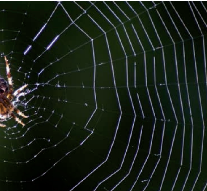
Figuur 1. Welke eigenschappen van spindraad zijn te verklaren?

want in dit artikel gaat het om de opdracht aan leerlingen om twee eigenschappen van spindraad te verklaren. Namelijk waarom zijn de draden zo veerkrachtig en waarom zijn ze zo sterk? Prachtig om leerlingen met zo'n opdracht aan het werk te zetten. Een en al verwondering hoe de spin in staat is zo'n prachtig web te produceren. En dat er door recent wetenschappelijk onderzoek zoveel kennis is waarmee we de veerkracht en de sterkte kunnen verklaren.